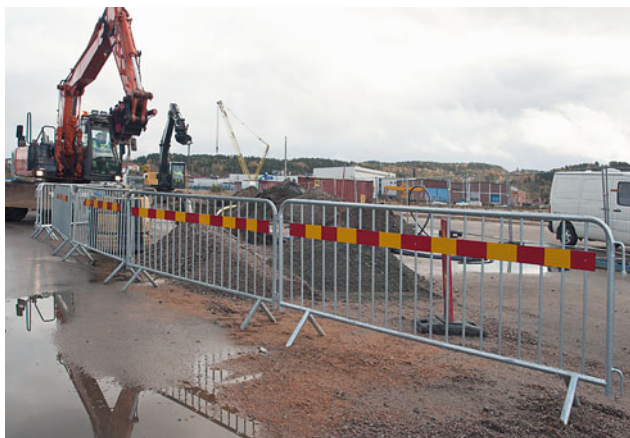
Räcke med höga fötter och reflexplåt.

QR Universalräcke används för temporär avspärning vid exempelvis byggarbetsplatser i stadsmiljö eller idrottsevenemang.