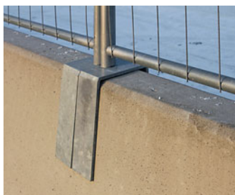
Exempel på fundament till betongbarriär av annat utförande.